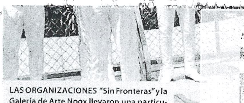
LAS ORGANIZACIONES "Sin Fronteras" y la Galería de Arte Noox llevaron una particular serenata a plena luz del día a la embajada de Estados Unidos, en la que el mariachi interpretó el himno de esa nación como un mensaje de solidaridad, tolerancia, hermandad y cercanía.

Con fundamento en los artículos Décimo Cuarto de los Estatutos de la ASOCIACIÓN DE EMPRESARIOS VENEZOLANOS EN MÉXICO, SOCIEDAD SOCIAL, se celebrará a las diez y cinco en la sala tipo "E" situada en la central de estado de